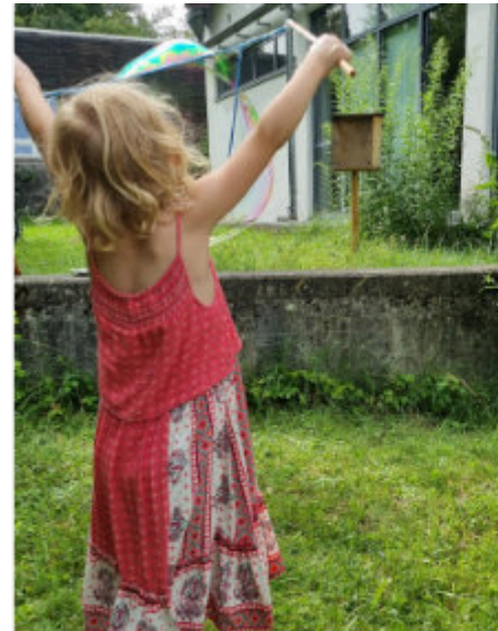
Die Kinder hatten viel Spaß mit den Seifenblasen