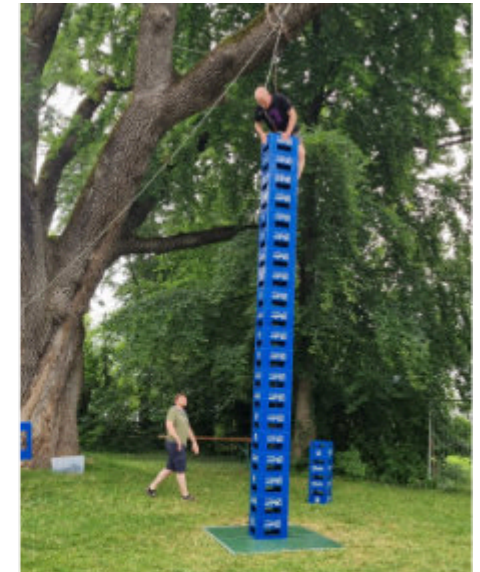
Wenn der Pfarrer hoch hinaus will